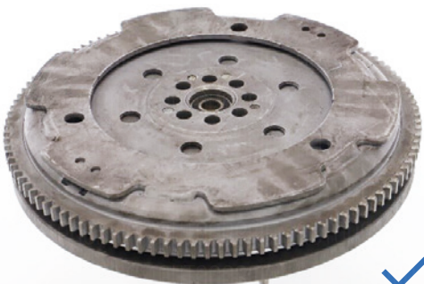
Kompletna część bez uszkodzeń