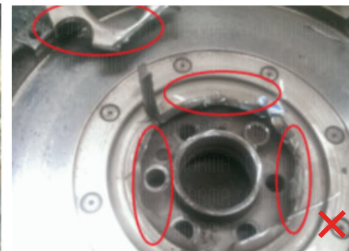
Uszkodzenia po demontażu