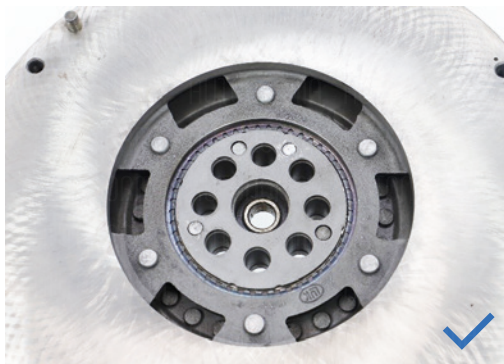
Uchwyty po demontażu nieuszkodzone