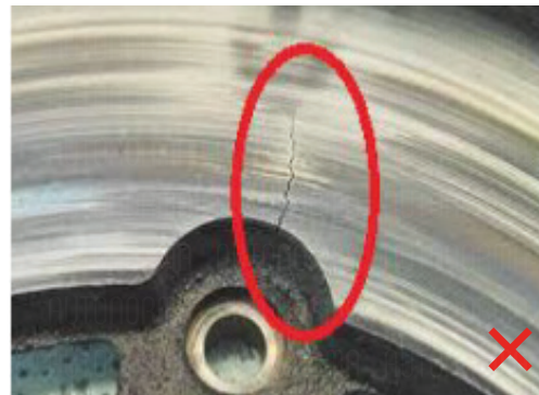
Pęknięta powierzchnia części