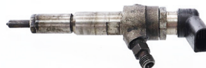
Kompletna część bez uszkodzeń